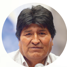
Evo Morales Ayma

Ex Presidente de la República Federativa de Brasil.