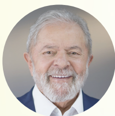
Luiz Inácio Lula da Silva